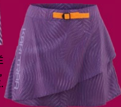
UŽ NEHLÍDEJTE SUKNI, ALE UŽÍVEJTE SI. ANE