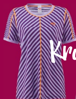
HIT LÉTA, JEDINÉ MERINO. RETRO, KTERÉ FUNGUJE. SMALE