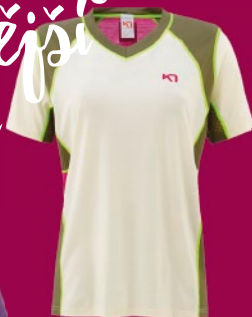
VZDUŠNÉ MERINO TRIKO PRO LETNÍ NEJEN SPORTOVNÍ DNY. DOPORUČUJE SAMÁ KARI TRAA. VOSS